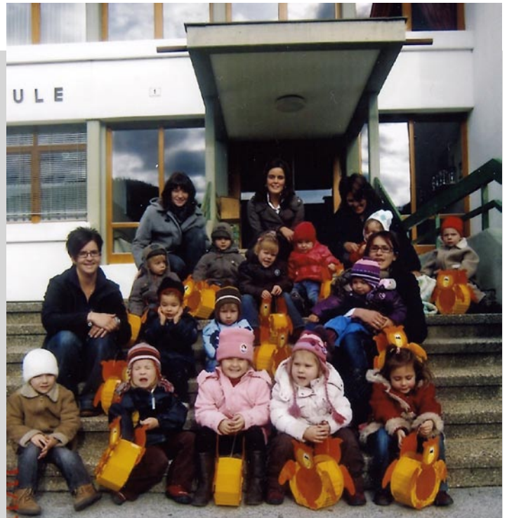
„Die Burgspatzen“ - Kinder mit ihren Betreuerinnen

Unser Spaziergang führte uns dann in die Stadtpfarrkirche, wo wir die Statue des Hl. Martin bewundern konnten. Vorher zogen wir aber noch mit unserem Martinslied durch die Volksschule. Danach ging es fröhlich und mit Gesang zurück in die Kindergruppe.