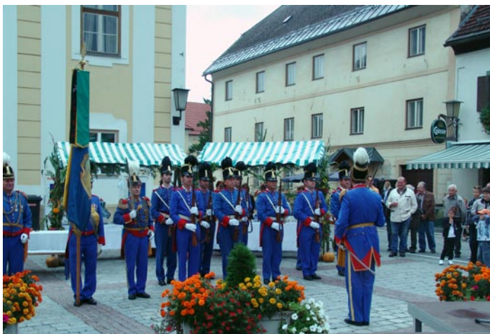
Der Schützenzug des Bürgerkorps Straßburg beim HeimatHerbst 2009

Fronleichnam in Lieding Bischofsempfang in Straßburg Landesschützenreffen in Spittal/Drau 200 – Jahr Andreas Hofer-Feier in Innsbruck