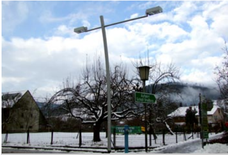
- Neue Schutzwegbeleuchtung - Übergang Hauptstraße-Marktplatz

Große Bauvorhaben sind gut im Fluss, wie z.B. der Strassenabschnitt Gruschitzkreuz – Kreuzen. Der Radweg ist fertiggestellt, dieser wird im Frühjahr noch mit der Beschilderung und Rastplätzen komplettiert. Die Schutzwegbeleuchtung ist erneuert worden und trägt damit zu mehr Sicherheit für die Verkehrsteilnehmer bei. Für den Siedlungswohnbau wurde ebenfalls Vorsorge getroffen, indem die Fläche für 6 Einfamilien – Wohnhäuser angekauft wurde. Derzeit ist der Teilungsplan in Arbeit, die Gründe werden im Frühjahr für Bauwerber zur Verfügung stehen. Im Februar 2010 wird die Schlüsselübergabe im neu errichteten Wohnhaus Wolfsbichl erfolgen. In dieser Wohnanlage gibt es noch 2 freie Wohnungen.