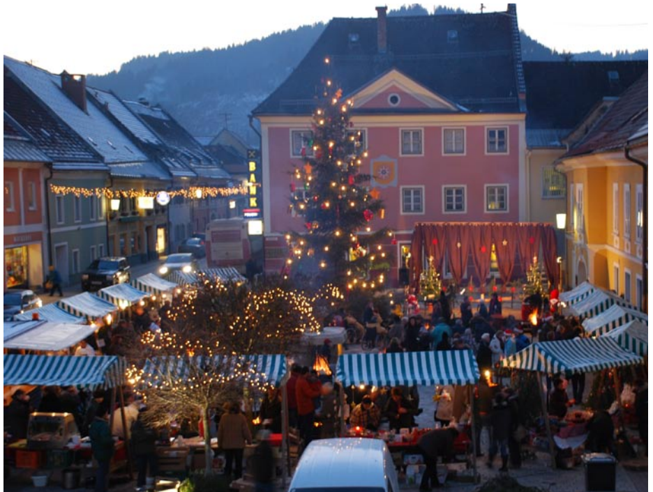
Pflegeheim Laetita - Adventfeier mit Christkindlmarkt am Hauptplatz

Um so befremdlicher ist es, dass sich hier massiver Widerstand regt und mit unwahren Argumenten versucht wird, die Bevölkerung gegen dieses Projekt zu mobilisieren. 20 Kinder von 6 bis 14 Jahren helfen aber, den Schulstandort, Volksschule wie auch Hauptschule, abzusichern. Des weiteren sind mit dieser Einrichtung 15 Arbeitsplätze verbunden und ein Bauvolumen von rund € 1,5 Mio. Anfragen über die nötige Ausbildung um hier einen Arbeitsplatz zu finden gibt es bereits.