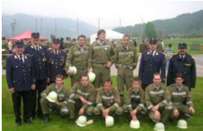
Die Kommandanten mit den siegreichen Kameraden der FF-Straßburg

der Raiffeisenbankstelle Straßburg zu ihrem 100jährigen Bestehen, welches mit einem großen Festakt auf Schloß Straßburg am 19.06.2006 begangen wurde.